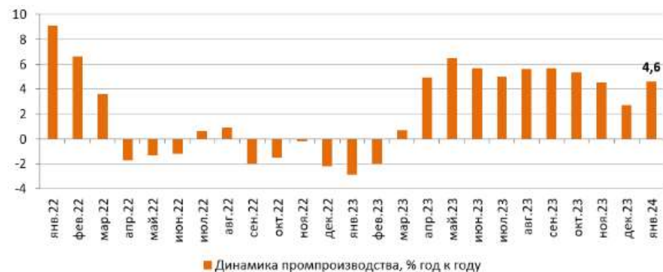
Рисунок П. 4.1. Динамика промпроизводства, % год к году

По данным Росстата, в январе 2024 года промышленное производство ускорило свой рост до 4,6% к соответствующему периоду предыдущего года после увеличения на 2,7% в декабре прошлого года.