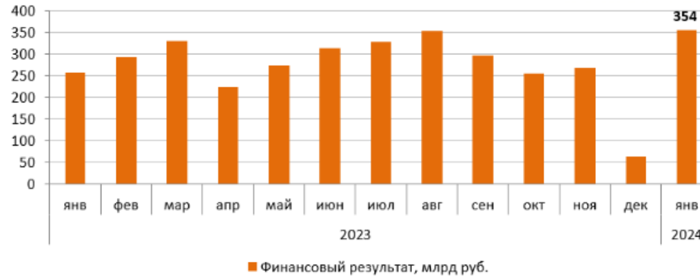
Рисунок П. 4.2. Динамика финансового результата банковского сектора по месяцам